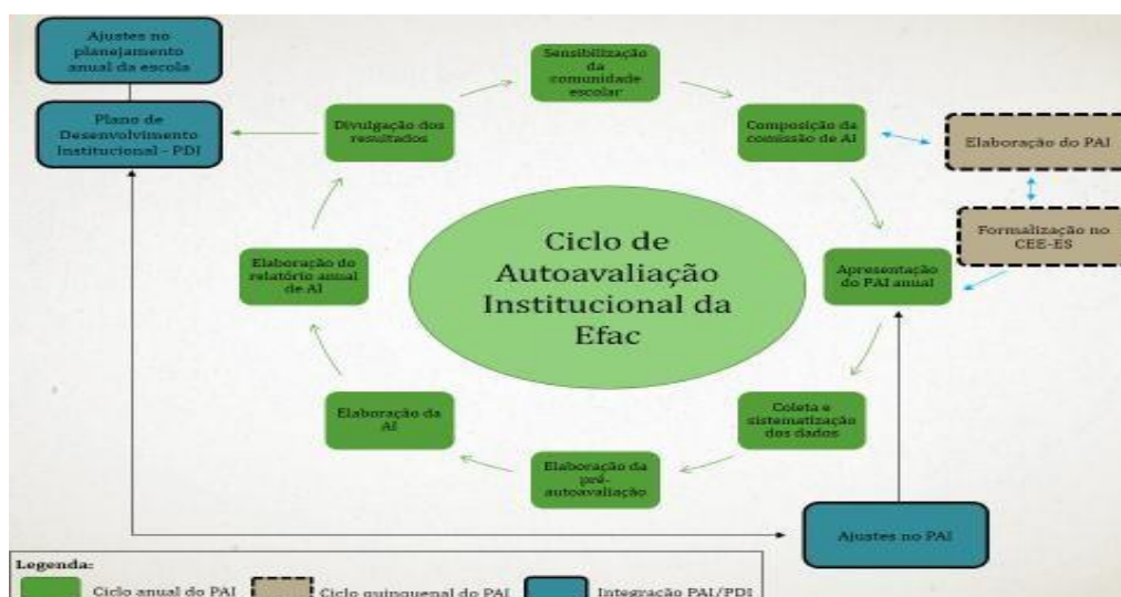
Figura 02 – Ciclo de autoavaliação anual e quinquenal da Efac e sua integração com o PDI

Por fim, teremos a fase da síntese ou consolidação da autoavaliação, que compreende a sistematização de todas as informações levantadas ao longo do ano letivo, em relação às dez dimensões avaliadas no âmbito desse instrumento. Ela terá as seguintes etapas básicas: revisão e ajustes no processo avaliativo; elaboração de relatórios conclusivos, anuais e quinquenais; discussão sobre o uso dos resultados, com encaminhamentos de ação; publicação e divulgação do relatório final. Alcançando essa fase, procede-se ainda a integração com o PDI, possibilitando verificar eventuais ajustes nesse instrumento. A figura abaixo, demonstra, de modo geral, o ciclo anual e quinquenal do PAI na Efac e sua integração com o PDI.