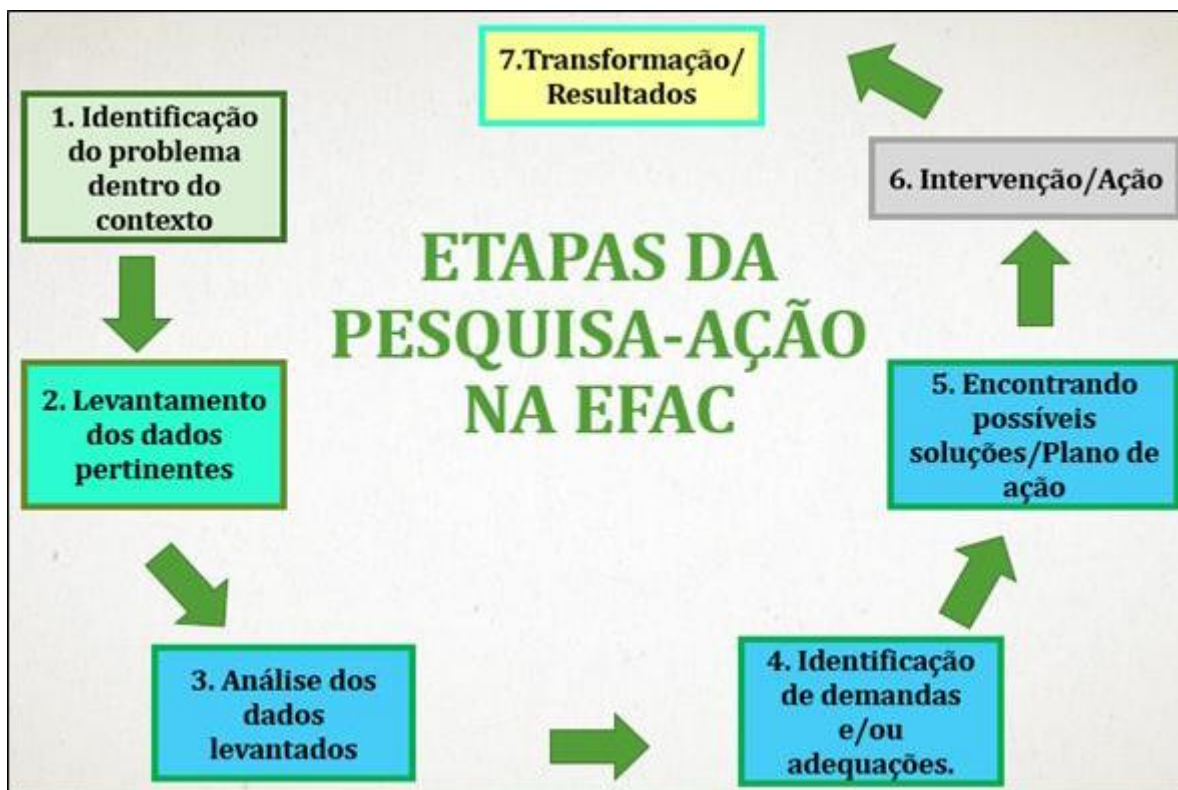
Figura 01 – Etapas da pesquisa-ação na Efac